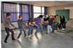
Inspirotheater: Eine Kulturklasse in Aktion.

Die Kinder- und Jugendtheater Chapeau Chapeau, das Hausensemble Bamberger Land, die Museen der Stadt Bamberg, Stadtmuseum oder das E.T.A. Hoffmann-Theater – an kulturellen Einrichtungen mangelt es der oberfränkischen Metropole Bamberg und ihrem Umland nicht. Dennoch ist es auch kein Wunder, dass der dortige GVB-Kreisverband das Projekt „Kultur.Klassen“ unterstützt. Die Kreditgenossenschaft übernehme damit Verantwortung für ihre Region: Sie führen Kinder und Jugendliche an das vielfältige kulturelle Leben vor Ort.