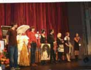
Die Schöne des E.T.A. Hoffmann-Theaters war Teil der Festkultur-Auftaktveranstaltung des bayernweiten Pilotprojekts „Kultur.Klassen“.